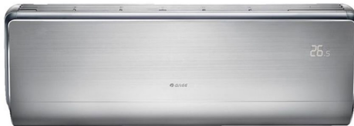
Gree additioneel luchtzuiveringsfilter